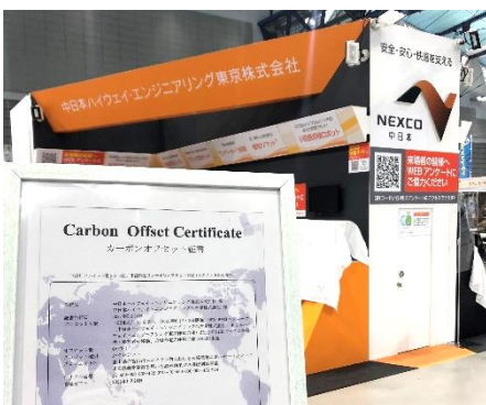
▲カーボンオフセット証書をブースへ掲示

2021年6月2日～3日に宮城県仙台市で開催された“EE東北’21(主催:国土交通省東北地方整備局)”の展示会に出展、当社で企画・デザイン・施工を実施したNEXCO中日本グループ（中日本ハイウェイ・エンジニアリング東京（株）及び中日本ハイウェイ・エンジニアリング名古屋（株））のブースにおいてカーボンオフセットの申請代行を実施しました。