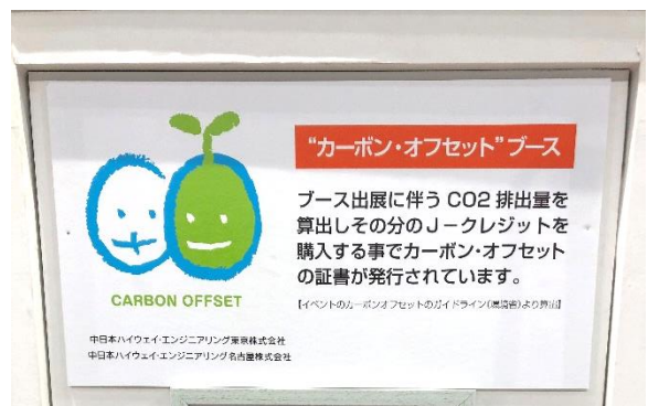
▲カーボンオフセット認証ロゴをブースへ掲示

報告書も発行されますのでCSR報告書や環境経営レポートへの転載も可能となります。